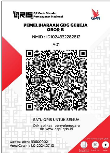
QRIS Pemeliharaan Gedung Gereja (BRI)