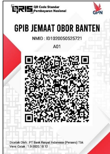
QRIS Rekening Umum Gereja (BRI)