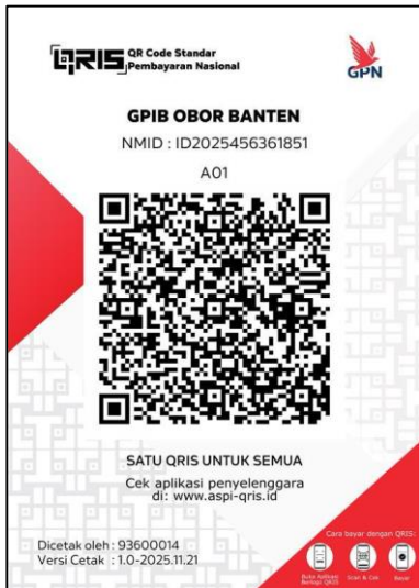
QRIS Rekening Umum Gereja (BCA)